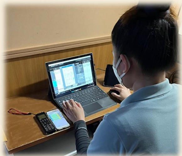
日本語で記録しています